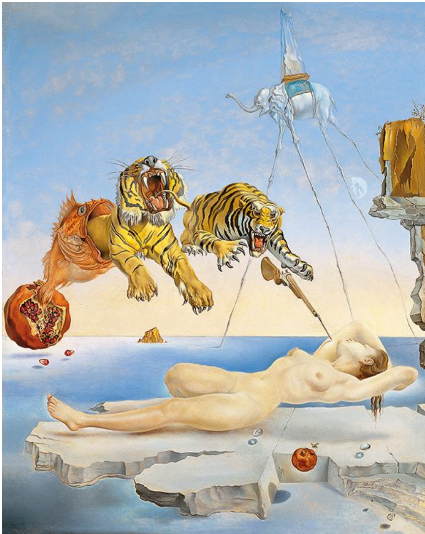
Tigres Salvador Dalí