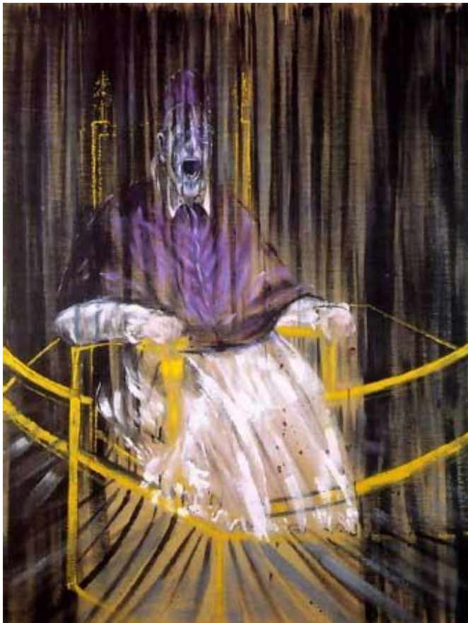
Inocenci X Francis Bacon, 1961.